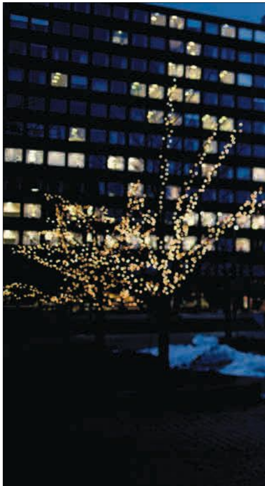
STEMME: Det er viktig å bygge videre på seirene til norske feminister, mener